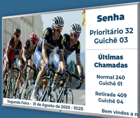
Totem Gerenciador de Atendimento